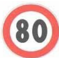
Figura II 50 Art. 116