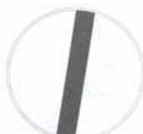
Figura II 70 Art. 119