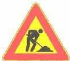
Figura II 383 Art. 31