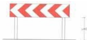
Figura II 393/a Art. 32