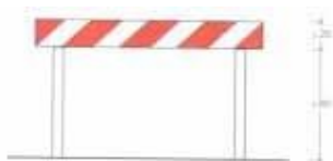
Figura II 392 Art. 32