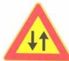
Figura II 387 Art. 31