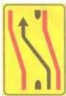
Figura II 412/a Art. 43