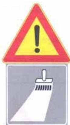
Figura II 391 Art. 31