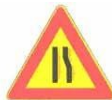
Figura II 386 Art. 31