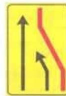
Figura II 411/a Art. 43

SEGNALE DI CORSIA CHIUSA (CHIUSURA CORSIA DI DESTRA)