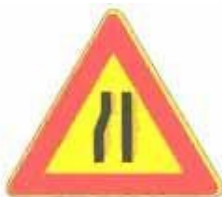
Figura II 385 Art. 31