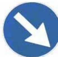
Figura II 82/b Art. 122