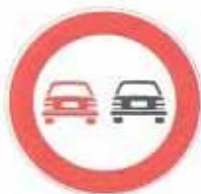
Figura II 48 Art. 116