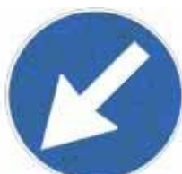
Figura II 82/a Art. 122