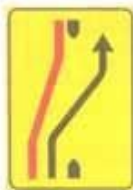
Figura II 412/b Art. 43