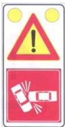
Figura II 391/a Art. 31