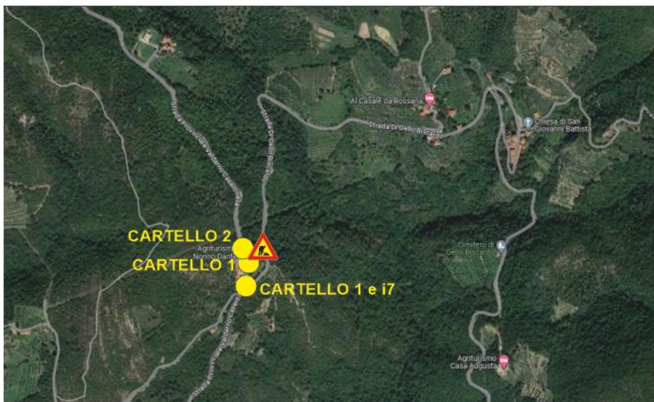
Planimetria SP 59 bivio Gello Biscardo