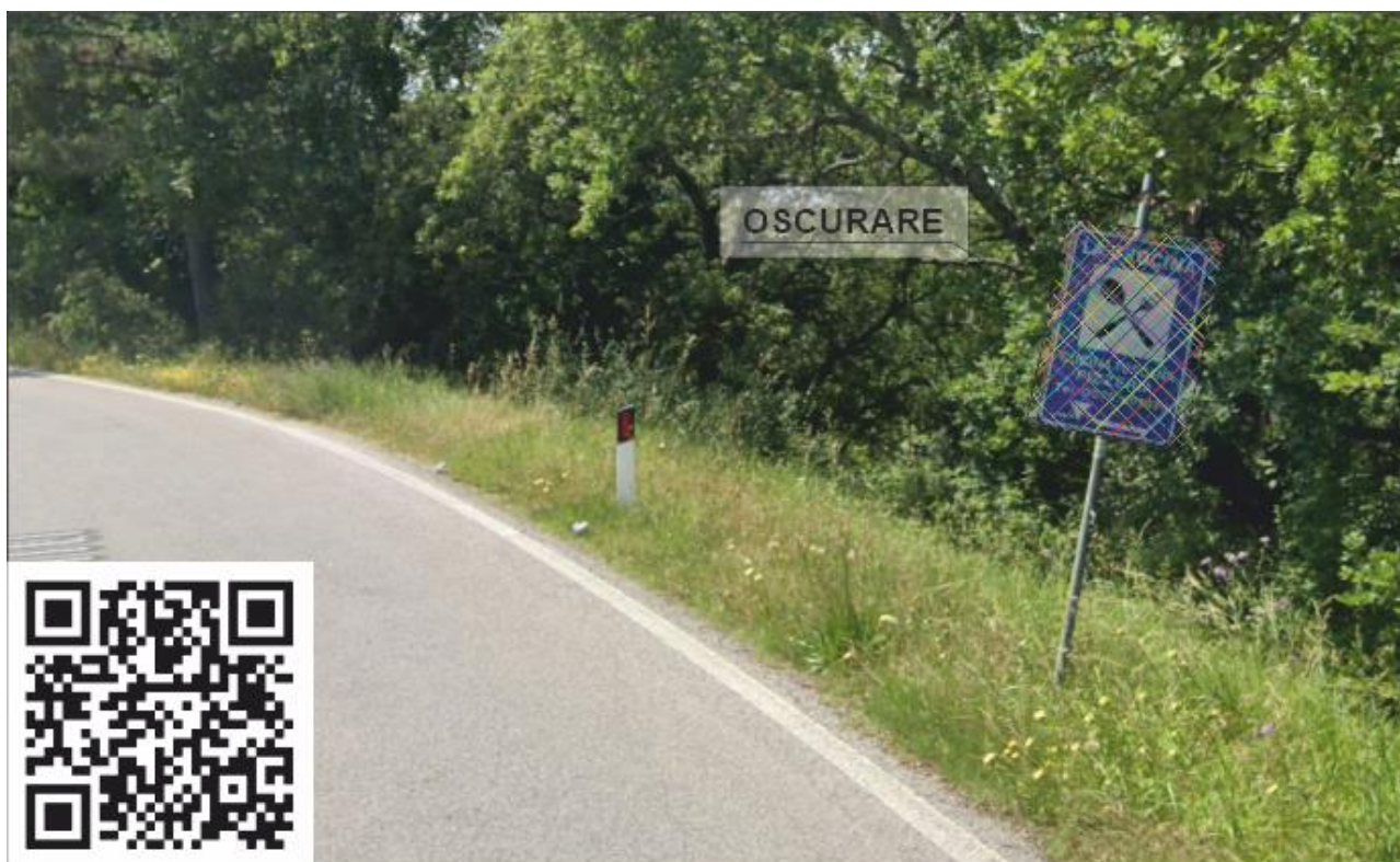
Zona 1 SP 1 Km 16+030 oscuramento