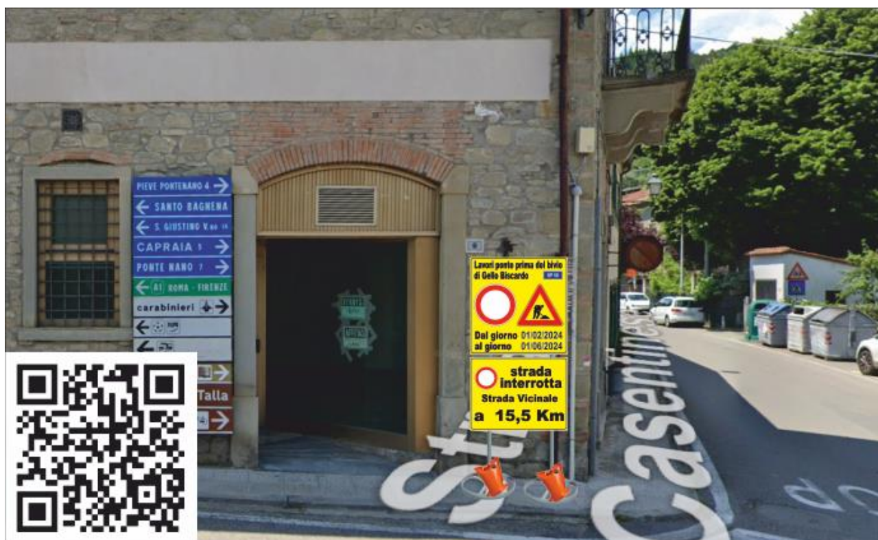
Zona 6 SP 59 Km 23+620 cartello 2 e i3