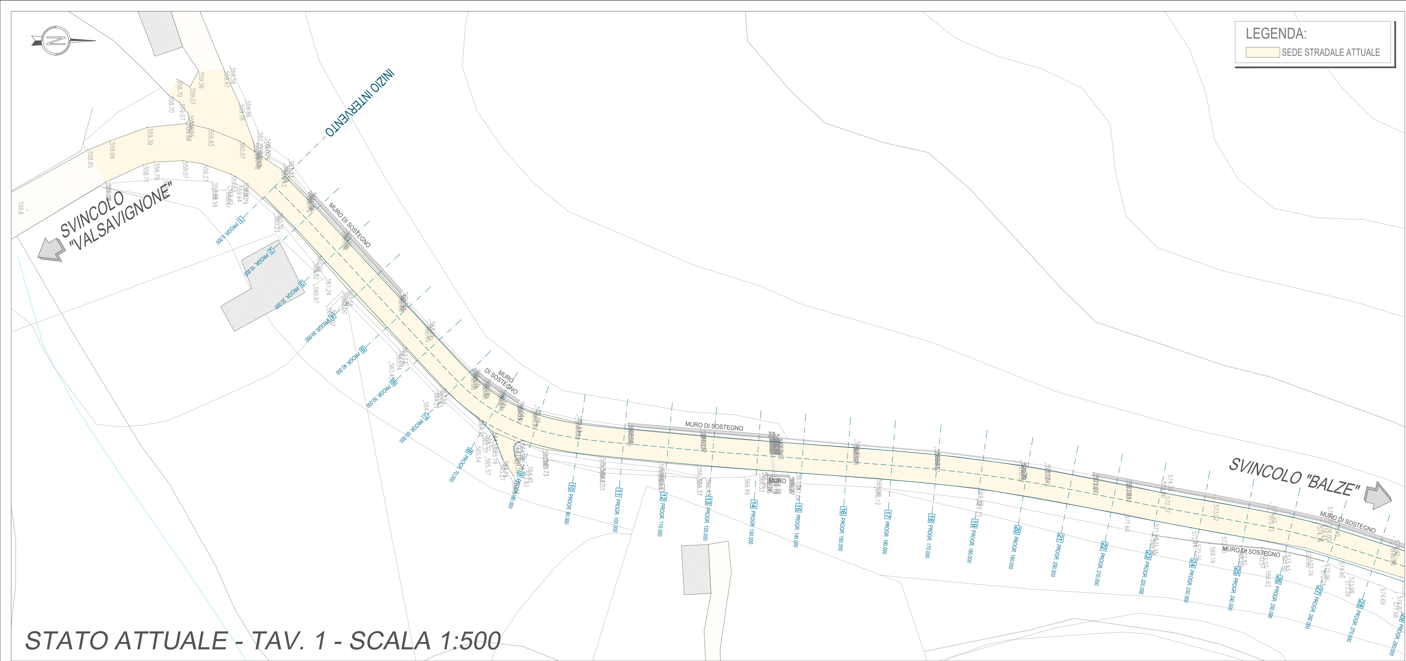
STATO ATTUALE - TAV. 1 - SCALA 1:500