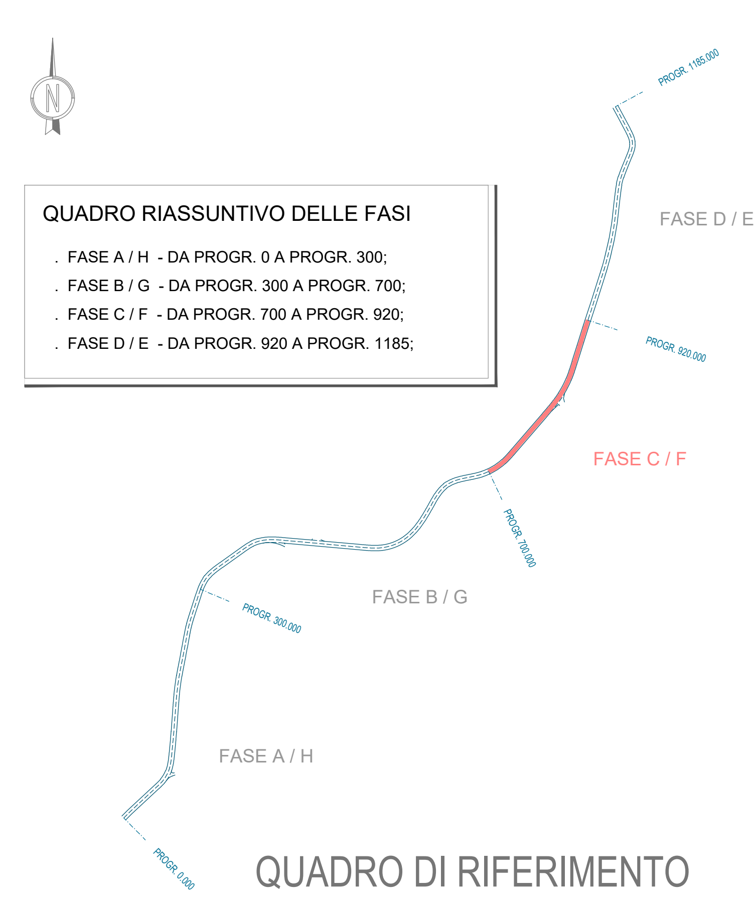
QUADRO DI RIFERIMENTO