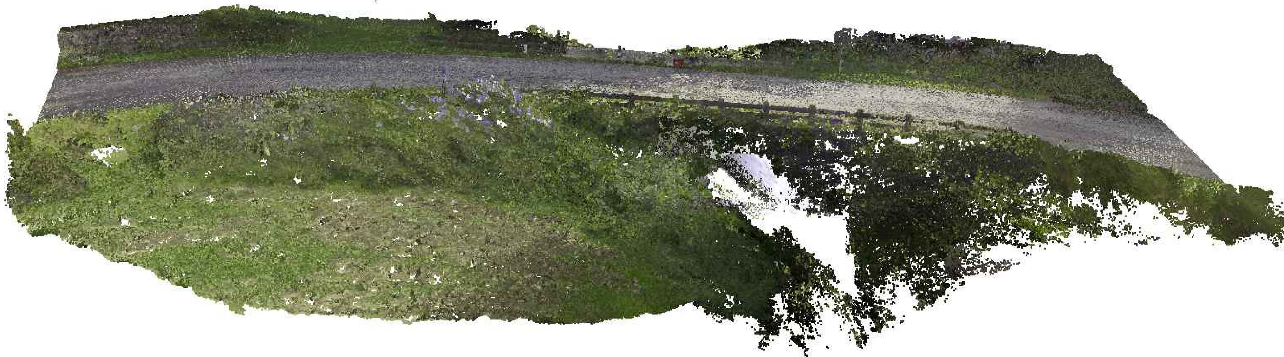
LASER SCANNER - VISTA 2