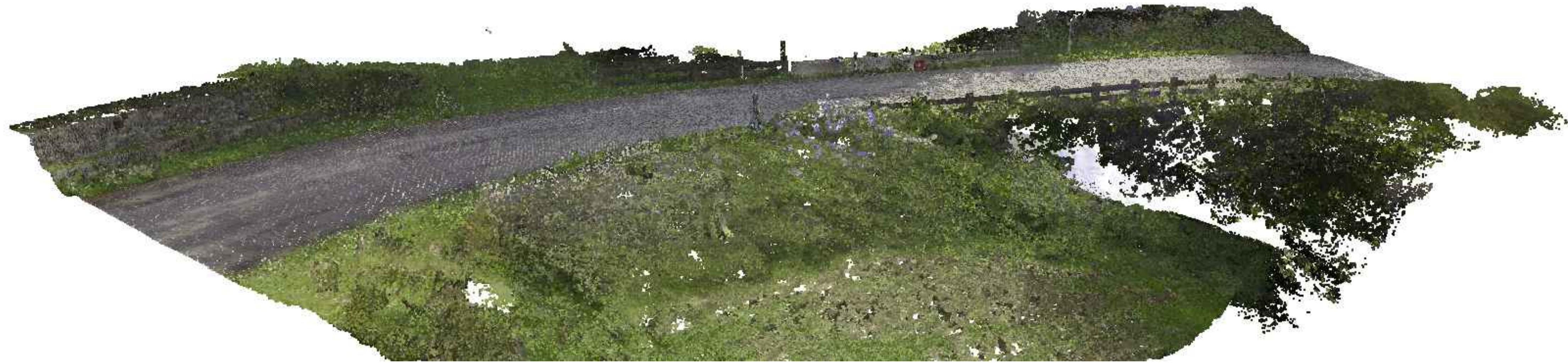
LASER SCANNER - VISTA 1