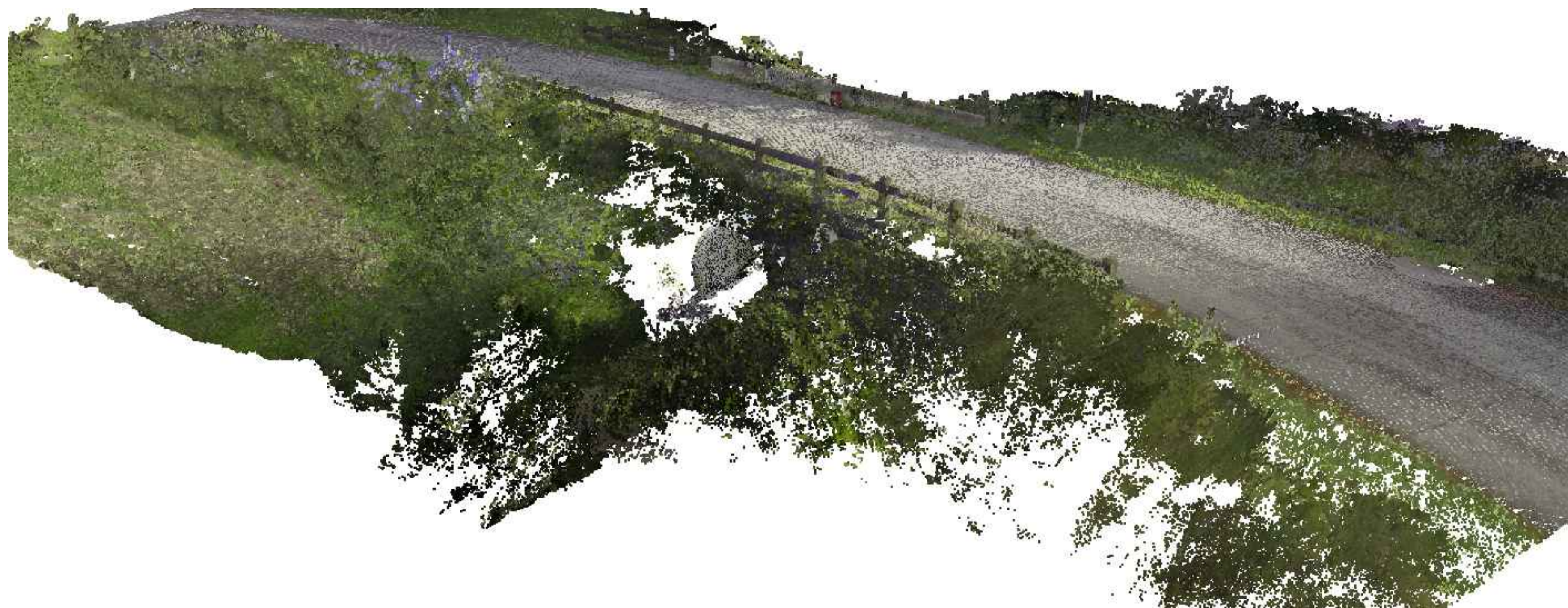
LASER SCANNER - VISTA 3

Rilievo con Laser Scanner effettuato in data 10/09/2024