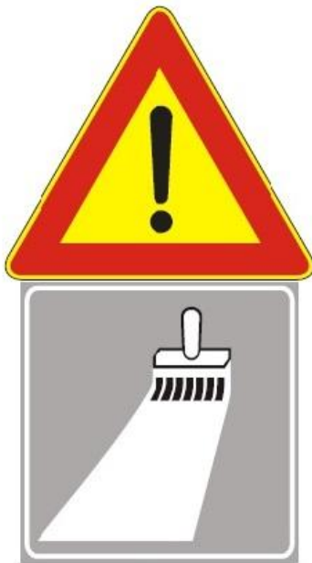
Figura Il 391 Art. 31