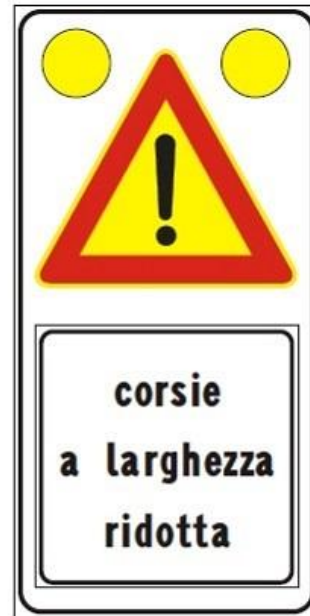
Figura Il 391c Art. 31