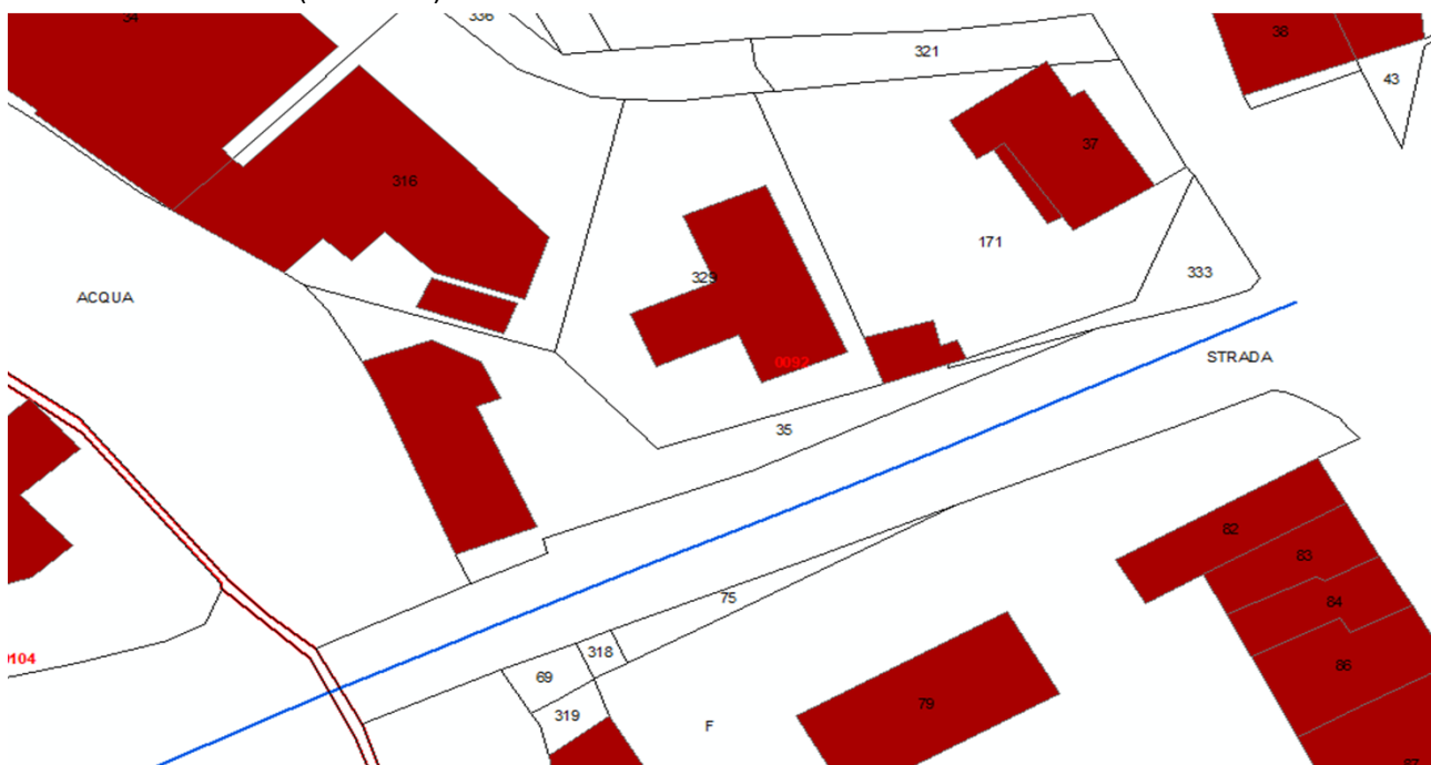
PLANIMETRIA CATASTALE (scala a vista):